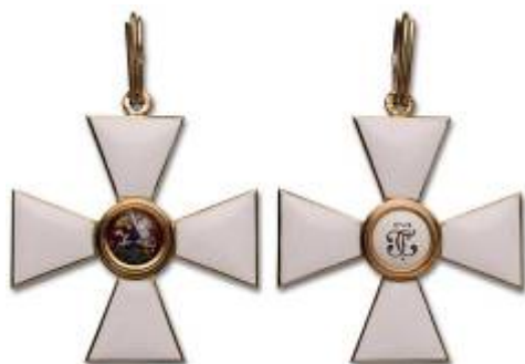
Орден Святого Георгия Победоносца

Звезда была четырехконечной, золотой, с монограммой и девизом в центре - «За службу и храбрость».