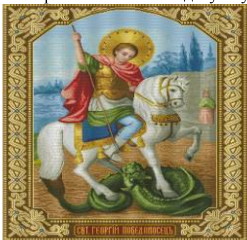
Икона «Георгий Победоносец»

Существует легенда, в которой рассказывают, что в озере жил змей, который пожирал людей. Осталась одна девица. Ее отвели к берегу озера. Когда змей стал приближаться к ней, вдруг появился на белом коне Георгий, который копьем поразил змея и спас девушку. Так он прекратил уничтожение людей.